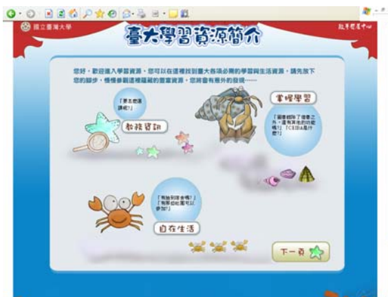
圖 2 教務、學習與生活之連結