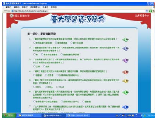
圖 3 學習資源探索活動

參與者對於本項活動，在五分量表上絕大部分的評鑑值均在 4.0 以上，特別是在「活動獎勵吸引人」、「活動內容有意義」以及「對我有具體幫助」等項上評分較高。學生普遍同意這次活動設計得活潑有趣，讓學生了解到許多本校的學習資源，並願意推薦這個網頁給其他同學或朋友。同時，大部份學生都同意這樣的學習資源簡介，除能幫助新生瞭解本校之外，校內其他舊生也需要這樣的資源導引。學生對此活動最感興趣的部份，以「學習」為最高，其次為「生活育樂」，「教務」最低。