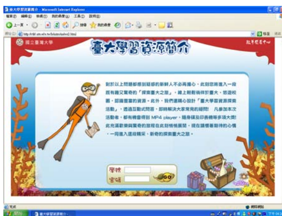
圖 1 學習資源簡介入口

10 題的學習資源問答以及 7 題學生的回饋與建議。填答方式為線上即時作答，答題後立即公佈正確解答，給予即時回饋 (列舉圖 1 至圖 3)。上線並回答活動內問題者共計 1327 人(不含僅上線瀏覽而未填答問題)，本中心於 12 月 11 日抽出 31 位得獎者，並統計出參與最熱烈之系所，公佈於中心網頁。